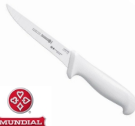
17339 - FACA 5315-05 DESOSSA RETA BRANCA MUNDIAL