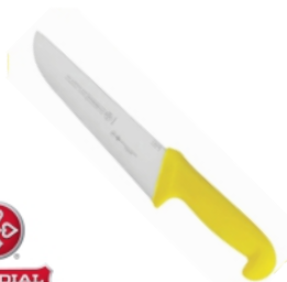
FACA 5510-8 MESA MUNDIAL 17702 - AMARELA 17271 - BRANCA