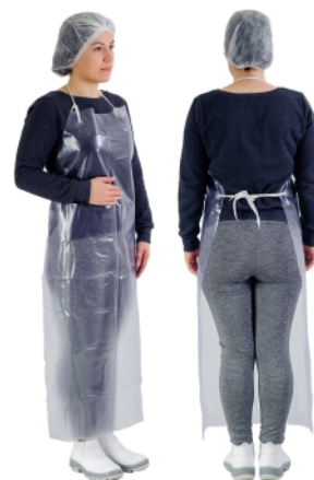
17635 - AVENTAL VINIL TRANSP. 120 X 70 CM FITILIO SOLD.