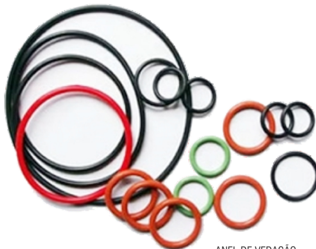
ANEL DE VEDAÇÃO CONSULTE!