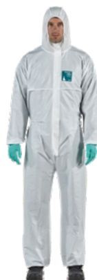
MACACÃO ANSELL BRANCO 1800 CA 39119 08559 - TAM. M 02088 - TAM. G 02679 - TAM. GG 05251 - TAM. XG