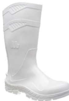
BOTA PVC C/LONGO C/F BRANCA MARLUVAS CA 40754