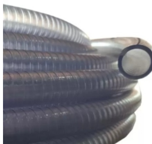
15769 - MANG. ATOXICA TRANSP. 3/4 POL.