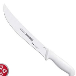
FACA 5517-10 CORTE AEREO MUNDIAL 17266 - AMARELA 17262 - BRANCA