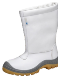
65C32-A-FRI-PDG COTURNO FRIG. B.AÇO MARLUVAS CA 39701

18184 - N° - 37 18191 - N° - 44 18185 - N° - 38 18192 - N° - 45 18186 - N° - 39 18193 - N° - 46 18187 - N° - 40 18188 - N° - 41 18189 - N° - 42 18190 - N° - 43