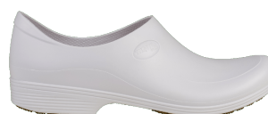
SAPATO EVA BRANCO MASCULINO S/BICO STIKY SHOES CA 39674