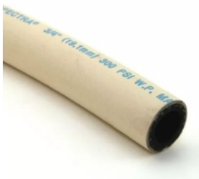
18663 - MANG. VAPOR FRIG. 3/4 BCA 300PSI ATÉ 93°