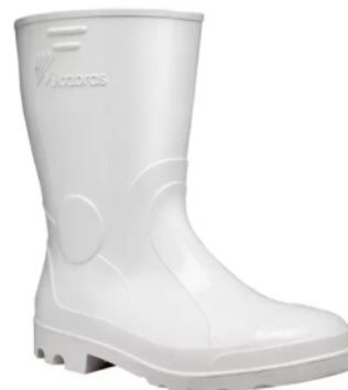
BOTA PVC BCA C/M VULCABRAS C/FORRO CA 36939