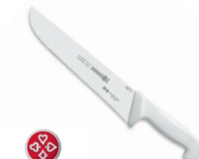
FACA 5520-10 AÇOUGUE MUNDIAL 19286 - AZUL 17260 - BRANCA