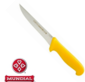
FACA 5516-6 DESOSSA CURVA MUNDIAL 17269 - AMARELA 17268 - AZUL 17263 - BRANCA 17267 - VERDE