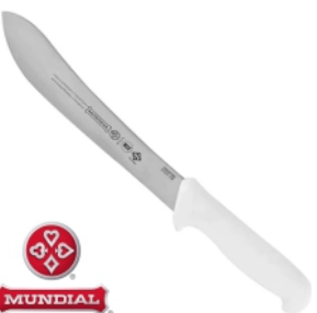
17327 - FACA 5525CF-8 EVISERAÇÃO REFIL BRANCA MUNDIAL