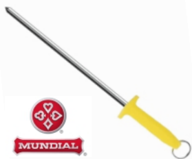
CHAIRA LISA 5540-12 MUNDIAL 17340 - AMARELA 17341 - AZUL 17258 - BRANCA 17509 - VERDE