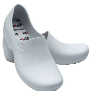
SAPATO EVA BRANCO FEMININO S/BICO STIKY SHOES CA 39848