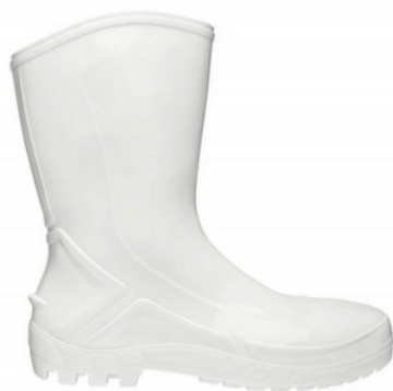
BOTA PVC C/MÉDIO C/F BRANCA MARLUVAS CA 42291