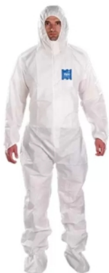
MACACÃO ANSELL BRANCO 67-200 CA 45613 18955 - TAM S-P 18956 - TAM M-M 18957 - TAM L-G 18958 - TAM XL-GG 18959 - TAM 2XL-XG 19200 - TAM 3XL-XGG