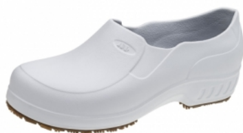
101FCLEAN-BR SAPATO EVA BRANCO S/BICO MARLUVAS CA 39213