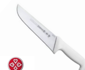
FACA 5520-08 AÇOUGUE MUNDIAL 17338 - AMARELA 17387 - VERDE