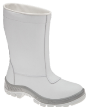
70C32 PET-PDG-BP COTURNO FRIG. B.PAST. MARLUVAS C.A 31394

18453 - N° - 35 18178 - N° - 42 18454 - N° - 36 18179 - N° - 43 18194 - N° - 37 18180 - N° - 44 18174 - N° - 38 18181 - N° - 45 18175 - N° - 39 18182 - N° - 46 18176 - N° - 40 18183 - N° - 47 18177 - N° - 41