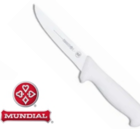
FACA 5515-6 DESOSSA RETA MUNDIAL 17270 - AMARELA 17437 - AZUL 17264 - BRANCA 17333 - VERDE