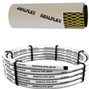
16538 - MANG. VAPOR FRIG. 3/4 BCA 50PSI REALFLEX