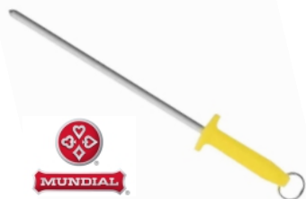
CHAIRA ESTRIADA 5540-12 MUNDIAL 17342 - AMARELA 17344 - AZUL 17272 - BRANCA 17343 - VERDE