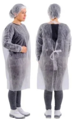
18881 - AVENTAL TNT 120X60CM BRANCO C/10 PREVEMAX