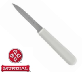
FACA 5601-03 LEGUMES MUNDIAL 17386 - AZUL 17257 - BRANCA