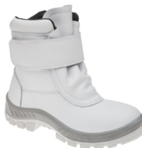
70C32 FRI-A COTURNO FRIG. F/LA B.AÇO MARLUVAS C.A 32163

18993 - N° - 34 17419 - N° - 42 17607 - N° - 36 17420 - N° - 43 17414 - N° - 37 17421 - N° - 44 17415 - N° - 38 18991 - N° - 45 17416 - N° - 39 18992 - N° - 46 17417 - N° - 40 17418 - N° - 41