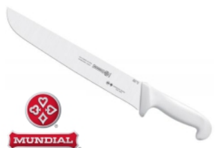
FACA 5520-12 AÇOUGUE MUNDIAL 17265 - AMARELA 17508 - AZUL 17261 - BRANCA 17701 - VERDE