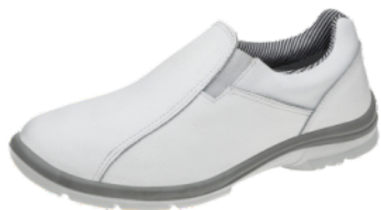
50F61 SRV TENIS ELAST. BRANCO S/BICO MARLUVAS CA 32817

16916 - N° - 33 15069 - N° - 40 15063 - N° - 34 15070 - N° - 41 15064 - N° - 35 15071 - N° - 42 15065 - N° - 36 15072 - N° - 43 15066 - N° - 37 15073 - N° - 44 15067 - N° - 38 15074 - N° - 45 15068 - N° - 39