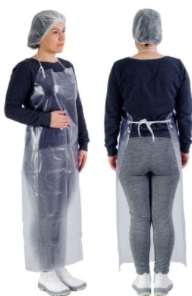
AVENTAL VINIL TRANSP. CORDÃO NYLON C.A 19169 17242 - 120 X 60 CM 15432 - 140 X 70 CM