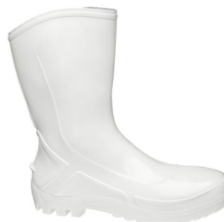
BOTA PVC C/MÉDIO S/F BRANCA MARLUVAS C.A 42291

17273 - N° - 35 17280 - N° - 42 17274 - N° - 36 17281 - N° - 43 17275 - N° - 37 17282 - N° - 44 17276 - N° - 38 17283 - N° - 45 17277 - N° - 39 17278 - N° - 40 17279 - N° - 41