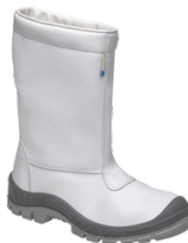
70C32FRI-PDG-A COT. FRIG. F/LA B.AÇO MARLUVAS CA 32207

17609 - N° - 36 17616 - N° - 43 17610 - N° - 37 17617 - N° - 44 17611 - N° - 38 17997 - N° - 45 17612 - N° - 39 17998 - N° - 46 17613 - N° - 40 18197 - N° - 48 17614 - N° - 41 17615 - N° - 42