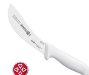
FACA 5519-6 COURO MUNDIAL 17453 - AMARELA 17259 - BRANCA