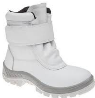
70C32 FRI-BP COTURNO FRIG.F/LA B.PLAST. MARLUVAS C.A 32206

17659 - N° - 37 17667 - N° - 43 17660 - N° - 38 17668 - N° - 44 17663 - N° - 39 17669 - N° - 45 17664 - N° - 40 17665 - N° - 41 17666 - N° - 42