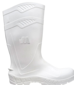
BOTA PVC C/MÉDIO C/F BRANCA AWORK MARLUVAS CA 40648