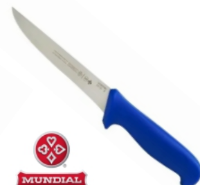
17400 - FACA 5331-6 AZUL MUNDIAL