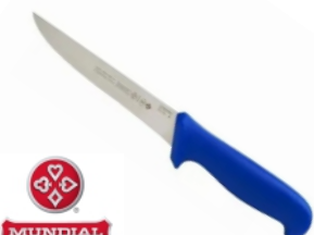
FACA 5515-5 DESOSSA RETA MUNDIAL 18119 - AZUL 17737 - BRANCA 17510 - VERDE