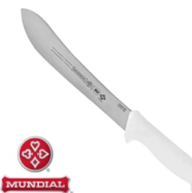
17326 - FACA 5525SA-8 EVISERAÇÃO BRANCA MUNDIAL