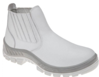
70B19 GI-A BOTINA ELAST. BCA BICO AÇO GASP. INT. MARLUVAS CA 31801

16346 - N° - 35 15060 - N° - 42 16345 - N° - 36 15061 - N° - 43 15055 - N° - 37 15062 - N° - 44 15056 - N° - 38 19031 - N° - 45 15057 - N° - 39 19032 - N° - 46 15058 - N° - 40 15059 - N° - 41