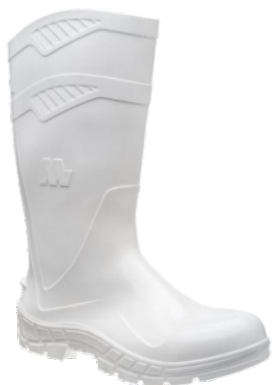
BOTA PVC BCA MARLUVAS C/LONGO C/F 35/6 B. PALM. ACO CA 40584